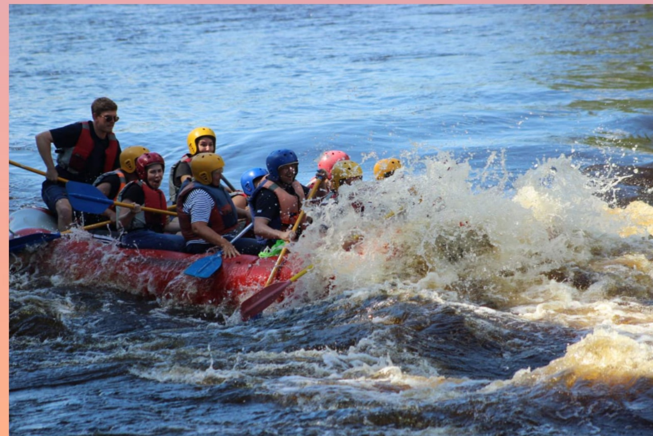
Сплав на рафтах